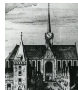
kerk in 16 e en 17 e eeuw