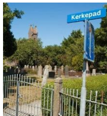
naast de kerk